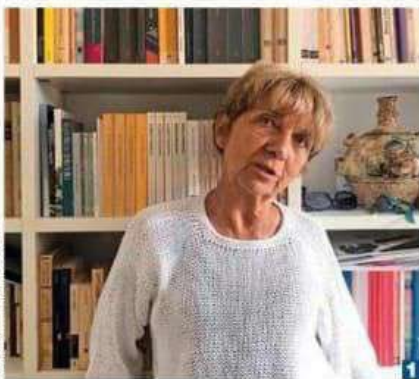
ALBERTA BASAGLIA / ANSA

Chissà, forse è proprio per quel carattere gentile e algido che Trieste riesce a digerire la rivoluzione che cova nel suo manicomio. Di sicuro deve ringraziare il suo essere crocevia di ogni cosa e di